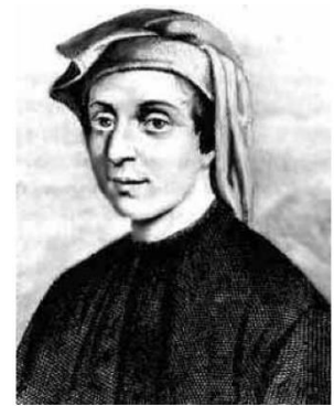
Leonardo da Pisa, dit Fibonacci

Proposer un algorithme récursif qui calcul le nombres de lapins au nième mois.